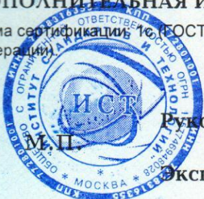
Схема сертификации 1С ГОСТ Р 53603-2020 Оценка соответствия. Схемы сертификации продукции в Российской Федерации.